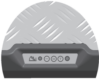
Ayak Isıtıcı Gösterge Paneli

Isıtıcı Maksimum Güçte çalıştığında 300 Watt enerji harcamaktadır. Cihazın yüzey sıcaklığının 60°C geçmesi durumunda kademeli olarak güç seviyesi düşecektir. Dış ortam koşullarına bağlı olarak cihazın enerji tüketimi dolayısıyla